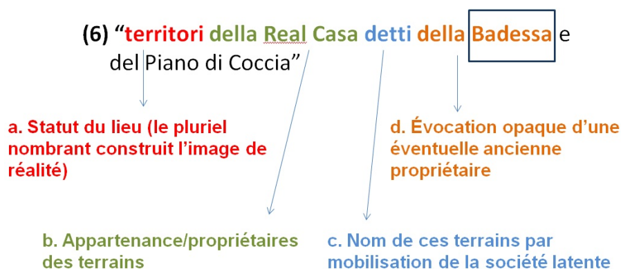
Fig. 2. Analyse de l'environnement discursif de l'occurrence (6)