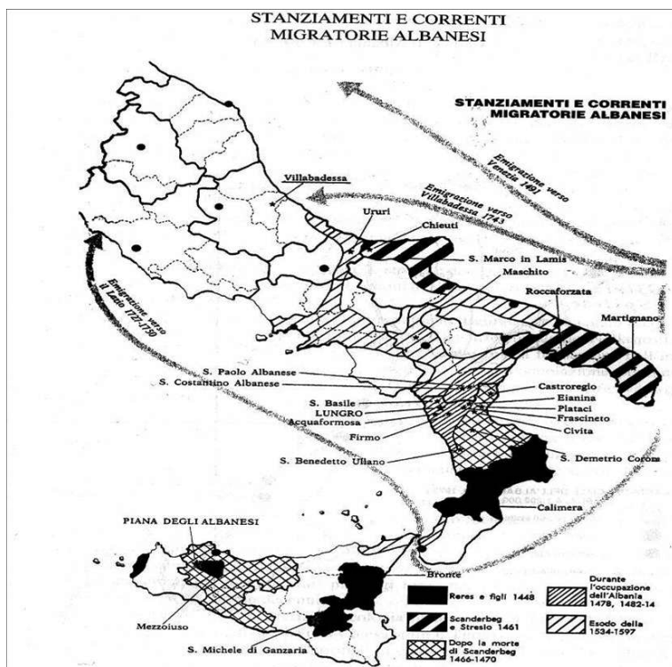
Fig. 1. Les courants migratoires albanais. Adapté de Bellizzi 1994 : 35

Situé à mi-chemin entre la mer Adriatique et la chaîne montagneuse des Apennins, le village de Villa Badessa compte aujourd'hui environ 300 habitants et relève de la commune de Rosciano, dans la province de Pescara (Abruzzes). Les premiers colons qui le fondèrent, de religion chrétienne, arrivèrent ici de Pigeras, un village du littoral de la région albanaise de Himarë, non loin de la frontière grecque. Fort probablement ils avaient dû quitter très rapidement Pigeras à cause d'un conflit avec un village voisin, Borsh, qui à l'époque était de religion musulmane. Après leur arrivée à Brindisi et une première halte à Pianella, le 4 mars 1744 Charles III de Bourbon leur assigna trois cents hectares environ de terrain, ancienne propriété de sa mère Élisabeth Farnèse, qui comprenaient les fiefs allodiaux de Abbadessa et de Piano di Coccia. C'est ainsi que naquit celle qui est aujourd'hui considérée comme la plus récente et la plus septentrionale des communautés historiques italo-albanaises d'Italie. Cette considération n'est pas anodine : ce village, qui relève de l'éparchie de Lungro, en Calabre (à plus de 500 kilomètres de Villa Badessa), a longtemps été très marginal, ce qui a contribué à opacifier son histoire.