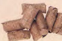
Trons de cop