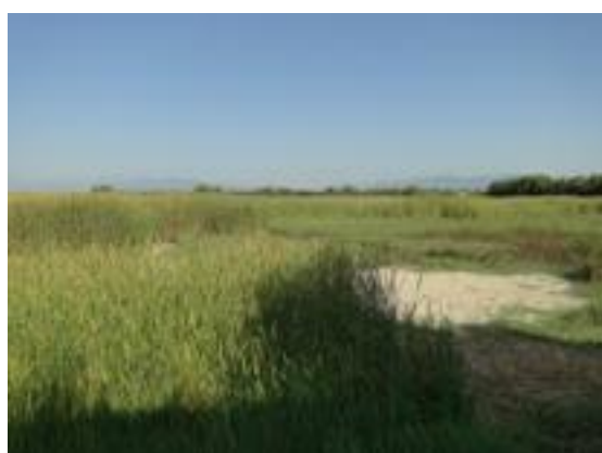
23/08/2011. Aguait dels Capons