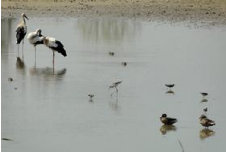
Estany del Cortalet (Aguait dels Roncaires). 23/08/2011.

Pel que fa als grans cama-llargs, es produeixen grans concentracions de diverses espècies, sobretot a la Rogera, però també als llocs amb aigua del Matà o a la Massona i de forma especial dins l'RNI1 a l'Estany d'en Pericos, indrets rics en peix. Hi destaquen grups de martinets blancs ( Egretta garzetta ), amb un màxim de 184 a la Rogera, a més de martinets rossos ( Ardeola ralloides ) o martinets de nits ( Nycticorax nycticorax ) i altres de més habituals ( Ciconia ciconia , Ardea cinerea , Ardea purpurea , etc.) juntament a una xifra de fins a 9 exemplars d'agró blanc ( Egretta alba ) a La Rogera a mitjan agost, on també s'observen alguns flamencs, espècie també vista a l'Estany d'en Pericos. També cal destacar que ja arriben els primers exemplars de corb marí gros ( Phalacrocorax carbo ) al parc durant el mes d'agost. Entre els rapinyaires destaca un falcó de la reina ( Falco eleonora ) al Fluvià a Caramany.