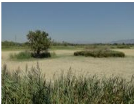
23/08/2011. Aguit de les Gantes