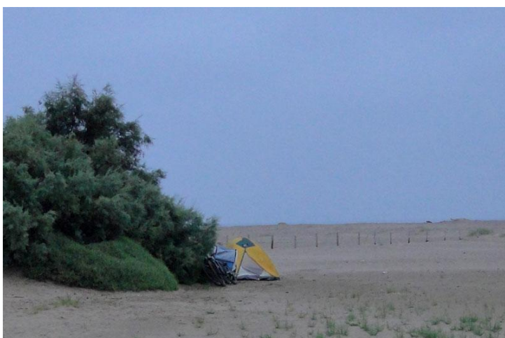
Acampats al rera-duna de la platja de can Comes. 19/08/2011.