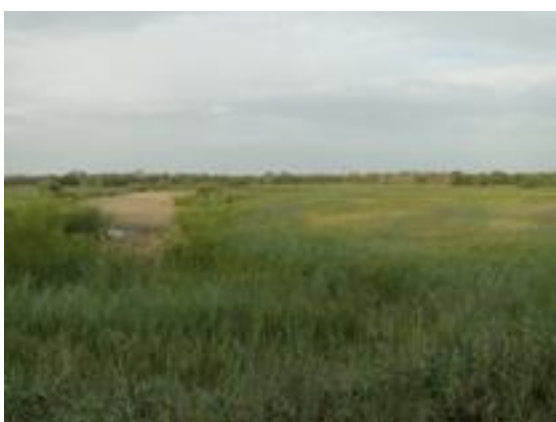
02/08/2011. Aguit dels Roncaires