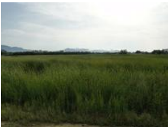
02/08/2011. Aguait de les Miloques