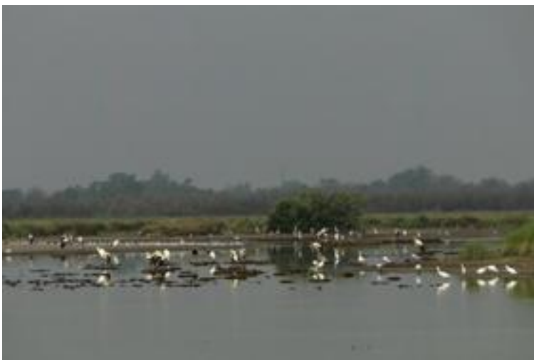
Gran concentració d'ardeids i altres cama- llargs. La Rogera. 19/08/2011.

Pel que fa als grans cama-llargs, es produeixen grans concentracions de diverses espècies, sobretot a la Rogera, però també als llocs amb aigua del Matà o a la Massona i de forma especial dins l'RNI1 a l'Estany d'en Pericos, indrets rics en peix. Hi destaquen grups de martinets blancs ( Egretta garzetta ), amb un màxim de 184 a la Rogera, a més de martinets rossos ( Ardeola ralloides ) o martinets de nits ( Nycticorax nycticorax ) i altres de més habituals ( Ciconia ciconia , Ardea cinerea , Ardea purpurea , etc.) juntament a una xifra de fins a 9 exemplars d'agró blanc ( Egretta alba ) a La Rogera a mitjan agost, on també s'observen alguns flamencs, espècie també vista a l'Estany d'en Pericos. També cal destacar que ja arriben els primers exemplars de corb marí gros ( Phalacrocorax carbo ) al parc durant el mes d'agost. Entre els rapinyaires destaca un falcó de la reina ( Falco eleonora ) al Fluvià a Caramany.