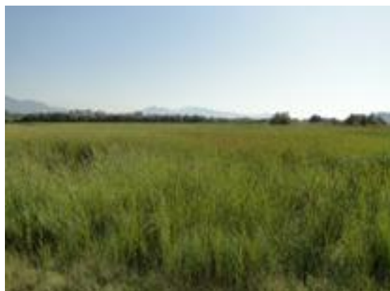
23/08/2011. Aguait de les Miloques