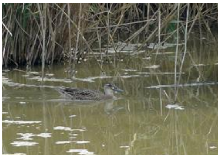
Roncaire Anas querquedula . Depuradora del Matà. 24/08/2011.

Durant el mes d'agost, com és habitual durant el període estival, la manca de pluges fa que els ecosistemes mediterranis, i els aiguamolls no en són cap excepció, quedin secs i eixuts en gran part. En els llocs que hi ha aigua, s'hi concentren bones proporcions d'ocells aquàtics, ja que aquest mes ja és plenament de pas post-nupcial, especialment d'ocells aquàtics, els quals troben a La Rogera, la Massona, la Depuradora del Matà i Estany d'en Pericos, els principals indrets de sedimentació i alimentació, a més de petits nombres en les taques d'aigua existents encara que poden romandre al Matà, Estany del Cortalet, etc.