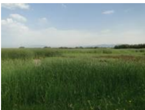
02/08/2011. Aguait dels Capons