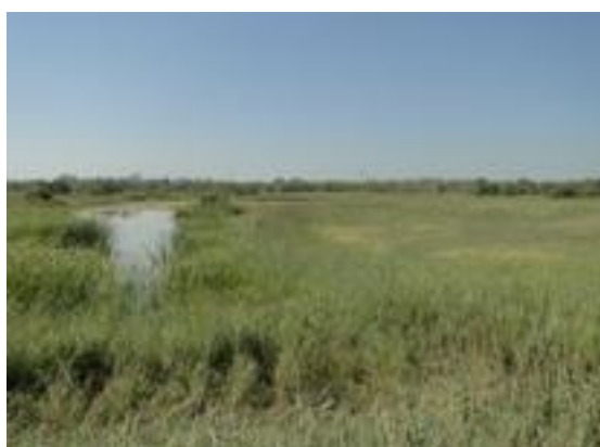
23/08/2011. Aguit dels Roncaires