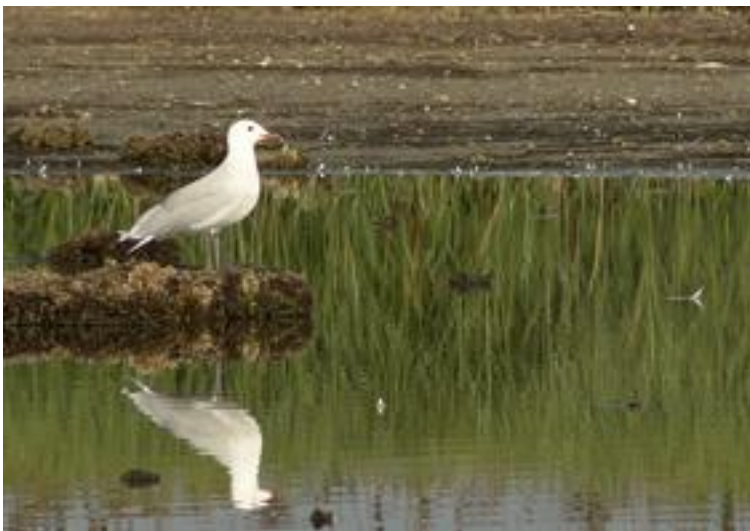
Gavina corsa Larus audouinii . La Rogera. 24/08/2011.

Pel que fa als limícols, la manca de fangueig a zones com el Matà, Cortalet o Massona, fa que les Llaunes, especialment la Rogera o estany d'en Túries i la platja, siguin els llocs de sedimentació durant aquesta tardor. En aquest sentit, a part de les gambes i afins ( Tringa sp. En general) que es troben també al Matà o basses que romanen al Cortalet, la majoria d'espècies es veuen a la Rogera, sobretot els territs ( Calidris ferruginea , C.alpina , C.minuta , etc.), la garsa de mar ( Haematopus ostralegus ), el bec d'alena ( Recurvirostra avosetta ), el pigre gris ( Pluvialis squatarola ), les tres espècies de corriol ( C.alexandrinus , C.dubius , C.hiaticula ), la fredeluga ( Vanellus vanellus ), el batallaire ( Philomachus pugnax ), -tot i que també s'observa a l'Estany de Palau-, encara que també al Matà o a l'Estany d'en Pericos -on s'observa un territ de Temminck ( Calidris temmincki ) i tètols ( Limosa limosa )-, acullen alguns exemplars, especialment aquest darrer lloc, amb una bona diversitat de limícoles al llarg del mes. Entre els làrids, destaquen la gavina corsa ( Larus audouinii ) a la Rogera i la platja. Finalment, d'entre ocells de mida més petita, s'observa un picot garser petit ( Dendrocopos minor ) al Matà i ja hi ha pas d'alguns insectívors ( Sylvia cantillans , Phylloscopus trochilus , Locustella luscinioides , Locustella naevia als canyissars de la RNI1, etc.).