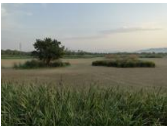
02/08/2011. Aguit de les Gantes