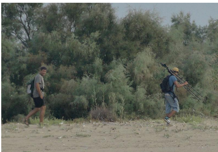
Visitants sortint de la Rogera i havent espantat tota la fauna existent. 24/08/2011.