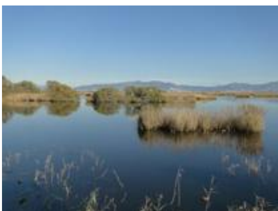
07/12/2011. Aguait del Bruel