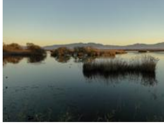
23/12/2011. Aguait del Bruel