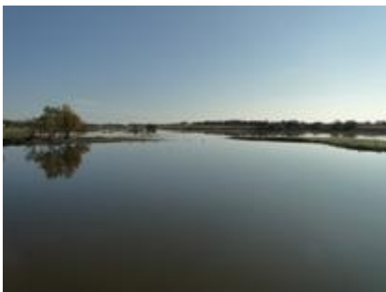
07/12/2011. Aguait Quim Franch