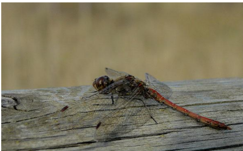
El Matà. 02/12/2011

A large, stylized handwritten signature in blue ink, appearing to be 'Ponç'.