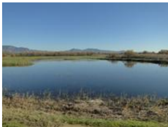
23/12/2011. Aguait de les Miloques