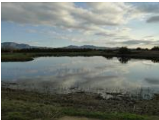
06/12/2011. Aguait de les Miloques