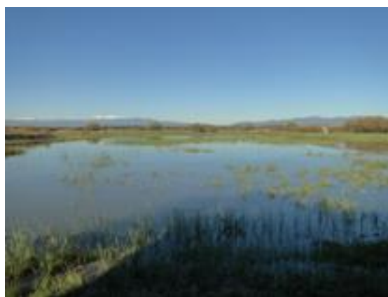
23/12/2011. Aguait dels Capons