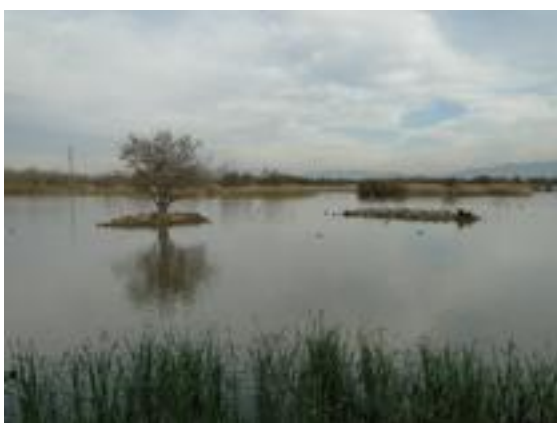
02/12/2011. Aguait de les Gantes