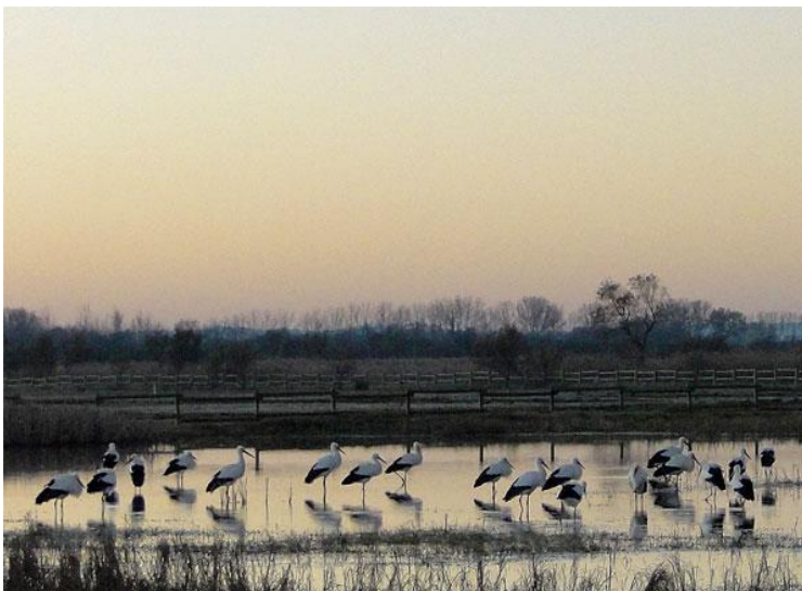
Cigonyes Ciconia ciconia Estany del Matà. 23/12/2011.

Els cabussets ( Tachybaptus ruficollis ) han estat presents especialment a la Massona, Cortalet, la Rogera, Caramany i Depuradora d'Empuriabrava i del Matà, mentre que els cabussos emplomallats ( Podiceps cristatus ) tenen xifres més baixes i un cabussó collnegre ( Podiceps nigricollis ) s'observa a l'Estany d'en Pericos, un lloc poc habitual. Pel que fa a ardeids i grans camallargs, s'observen bones xifres a l'Estany de Palau, on s'hi apleguen nombrosos bernats pescaires ( Ardea cinerea ), 13 agrons blancs ( Egretta alba ) espècie que també apareix en un nombre molt elevat a l'Estany d'en Pericos i al Matà, a més dels ardeids habituals. Més de 130 cigonyes ( Ciconia ciconia ) s'observen al Matà. Els flamencs ( Phoenicopterus roseus ) són presents de forma regular a l'Estany del Cortalet, amb una trentena d'exemplars. També cal dir que es formen els ajocadors de corbs marins ( Phalacrocorax carbo ) a la Massona, la Muga i a Caramany, alguns dels quals compten amb ardeids, aspectes ja explicats a l'informe d'hivernants del mes de desembre. Finalment, cal destacar l'observació d'un capó reial ( Plegadis falcinellus ) a l'Estany d'en Pericos. També s'observen algunes grues ( Grus grus ) a diferents indrets del parc, amb un màxim de 7 exemplars.