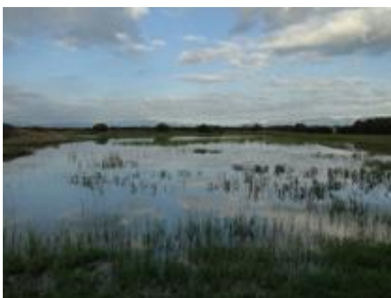
06/12/2011. Aguait dels Capons