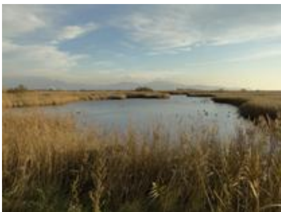
02/12/2011. Aguait del Gall Marí