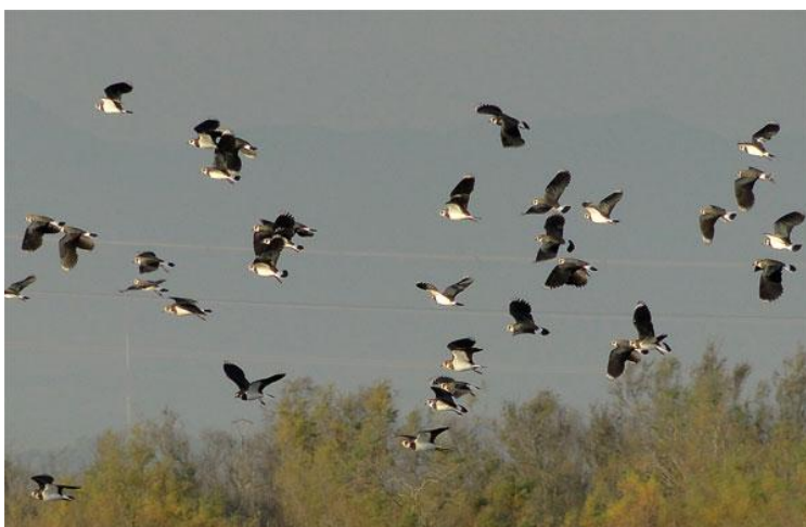
Fredelugues Vanellus vanellus . Estany del Matà. 02/12/2011.

Pel que fa a làrids, les xifres de gavina vulgar ( Larus ridibundus ) són ja les pròpies de període d'hivernada, mentre que a la platja de Can Comas hi ha alguns xatracos bec-llarg ( Sterna sandvicensis ).