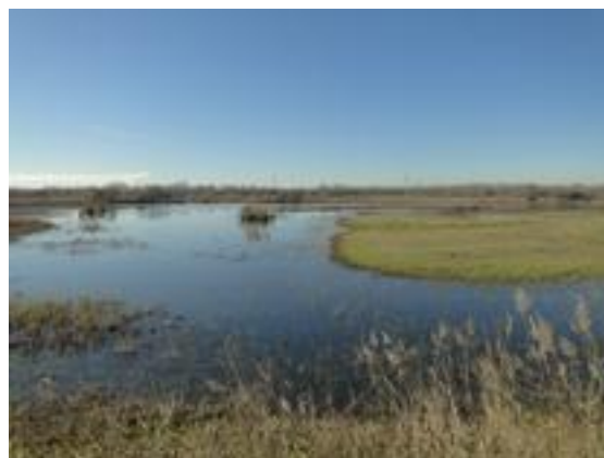
23/12/2011. Aguait dels Roncaires