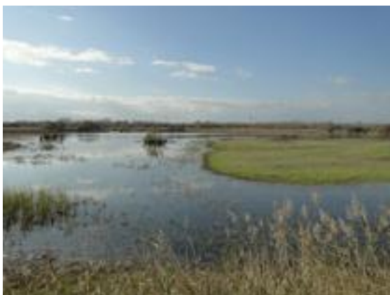
06/12/2011. Aguait dels Roncaires