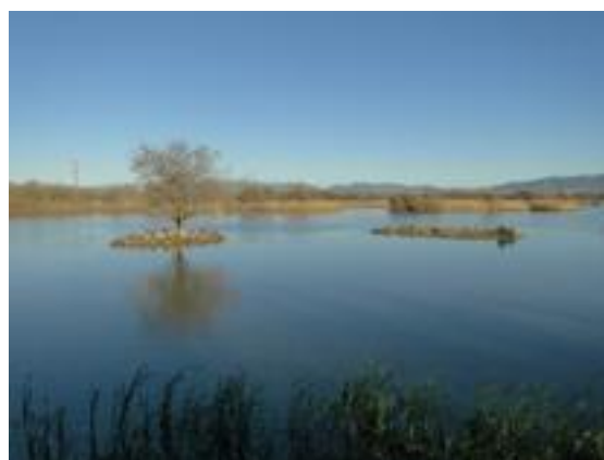
23/12/2011. Aguait de les Gantes