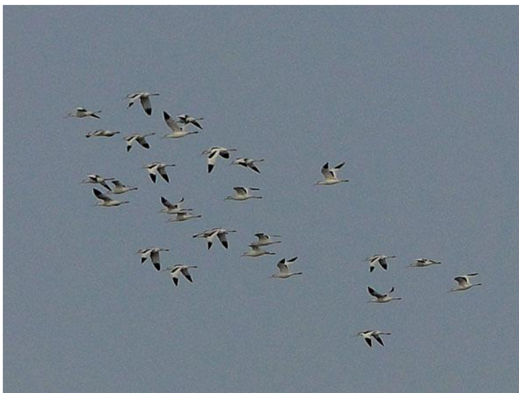
Becs d'alena Recurvirostra avosetta . La Rogera. 09/12/2011.

Pel que fa a làrids, les xifres de gavina vulgar ( Larus ridibundus ) són ja les pròpies de període d'hivernada, mentre que a la platja de Can Comas hi ha alguns xatracos bec-llarg ( Sterna sandvicensis ).