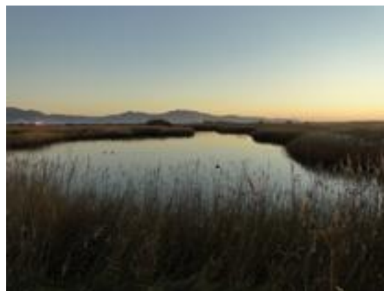
23/12/2011. Aguait del Gall Marí