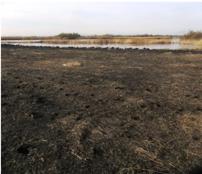
Gestió a la zona de Les Llaunes. 09/12/2011.