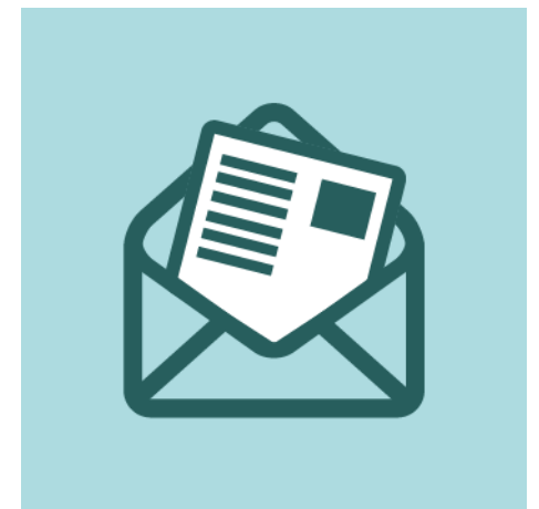
Vot i document identificatiu preparats