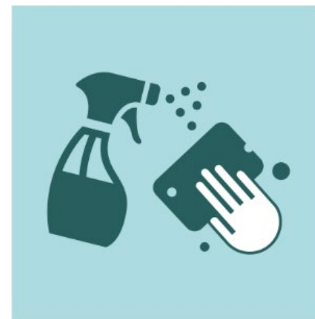
Neteja i ventilació adequada