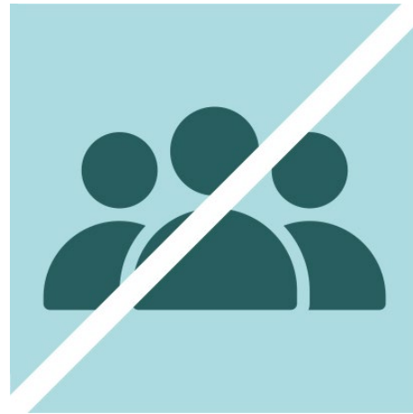
Reducció de la interacció social