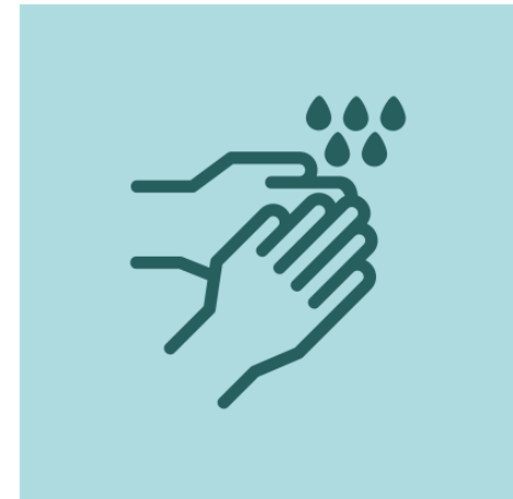
Desinfecció de mans