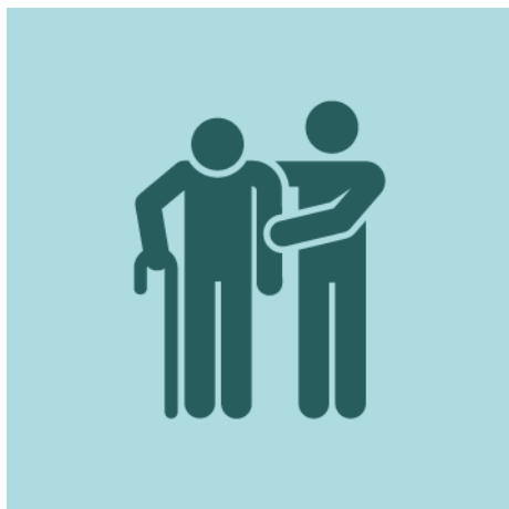
Prioritat persones vulnerables