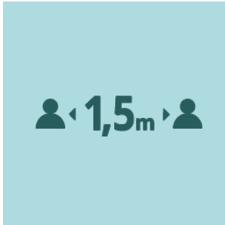
Distància de seguretat obligatòria